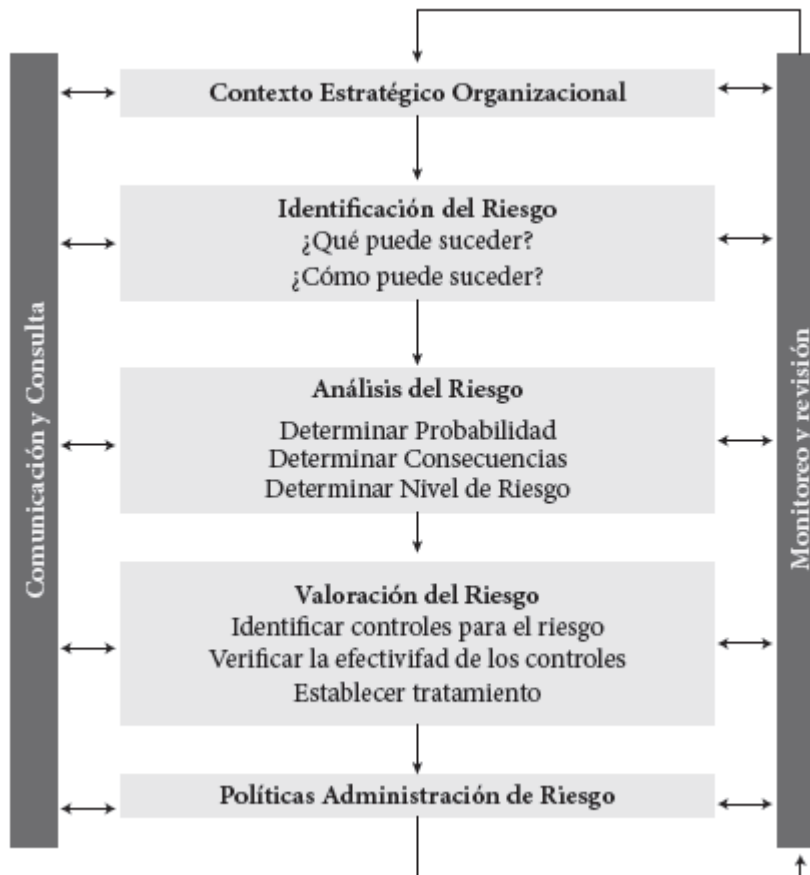
Imagen 2, proceso para la administración del riesgo en el INCIVA

El INCIVA, en su manual de riesgos versión 01, adoptado el 12 de octubre de 2016, nos muestra unos lineamientos para la mitigación de riesgos, como se visualiza en la siguiente imagen: